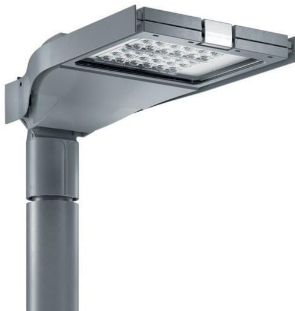
Esempio di corpo illuminante alto

Saranno realizzati in materiale metallico (alluminio o acciaio) e di colore grigio antracite.