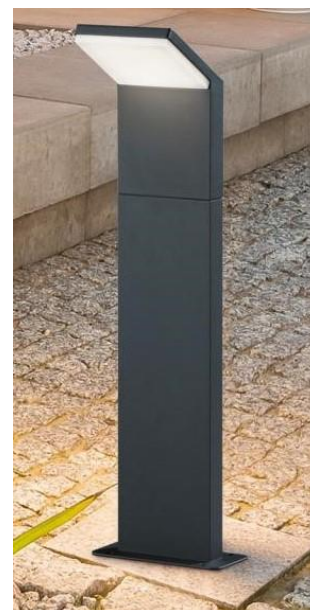
Esempio di corpo illuminante basso

Sarà cura dell'impiantista produrre relazione illuminotecnica finale con relativo calcolo e verifiche nel rispetto della normativa vigente.