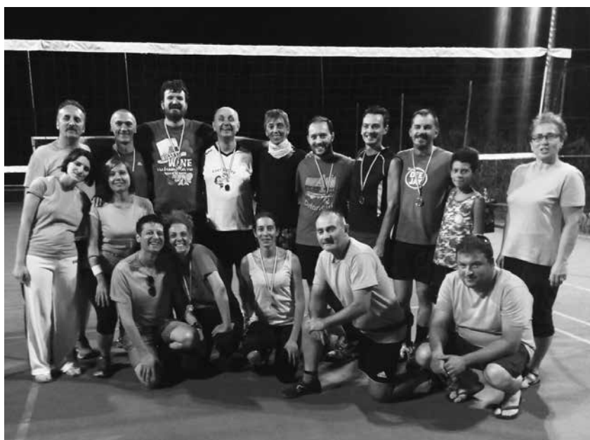
La squadra vincitrice del torneo con gli organizzatori