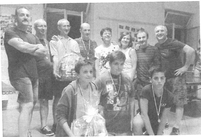
Foto di gruppo per i trionfatori del torneo di Ping-Pong

Ringraziamo l'associazione sportiva A.S. BARGANO'85 e il circolo S.LEONE (oratorio di Bargano) per le strutture messe a disposizione e diamo l'appuntamento per il prossimo anno.