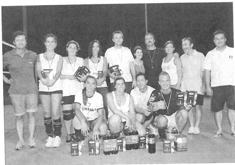
Gli organizzatori con i vincitori del torneo di Volley: gli Spritz